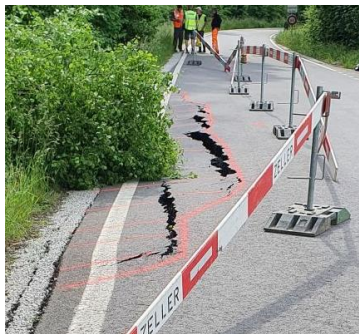
Schäden an der Illharterstrasse

Schäden gab es aber auch an Kulturen, Bächen und Flur- und Gemeindestrassen. Einige kleinere Schäden konnten bereits behoben werden, andere werden noch mehr Zeit in Anspruch nehmen. Einen grossen Schaden hat es an der Illharterstrasse in Lipperswil gegeben. Die im Jahr 2019 sanierte Strasse wurde in einem Abschnitt unterspült, die Böschung rutschte komplett ab und es gab tiefe Belagsrisse. Aus Sicherheitsgründen musste die Illharterstrasse am 10. Juni 2021 auf unbestimmte Dauer komplett gesperrt werden.